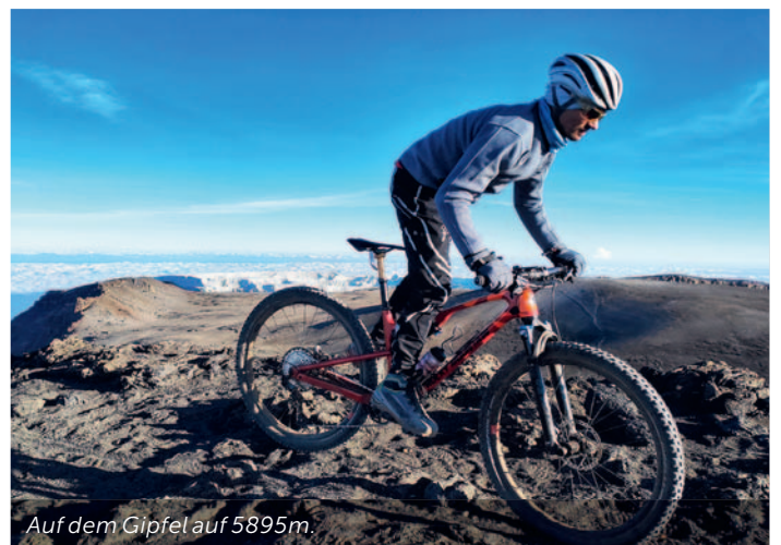
Auf dem Gipfel auf 5895m.