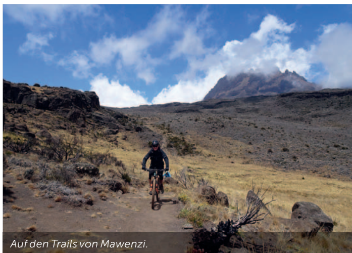
Auf den Trails von Mawenzi.

Bereits um 1.00 Uhr in der Früh ist Tagwache. Das ist sogar bei einer Luki-Tour Rekord! Wir steigen im Schein unserer Stirnlampen zu unseren Bikes hoch. Ab hier geht es noch weitere 450 Meter bergan, bis wir am Kraterrand sind. Dieser Punkt gilt bereits als erfolgreiche Kilimanjaro-Besteigung. Bis zum eigentlichen Gipfel geht es aber noch eine gute Stunde. Die Steigung wird ab nun deutlich flacher und im zweiten Teil kann man gar versuchen, wieder zu fahren. Schneeskulpturen und Gletschereis wachsen scheinbar aus dem Boden heraus. Die Szenerie wirkt surreal. Die Sonne kommt hinter dem Mawenzi Gipfel hervor und wir erleben eine Morgenstimmung, die uns tief beeindruckt. Wir stehen auf dem Dach von Afrika und auf einem der 7 Summits. Wir sind auf dem Berg, der vor fünf Tagen noch so unerreichbar weit weg war. Unsere Gefühle sind eine Mischung aus Glück, Zufriedenheit, Stolz und einer Portion Respekt vor der Abfahrt. Was nun folgt, dürfte die längste Abfahrt der Welt sein. Vorbei an Gletscher und Schneefeldern biken wir durch die sogenannten Frostschuttwüsten. Dann folgt das einzig längere Schiebe-/Trage-