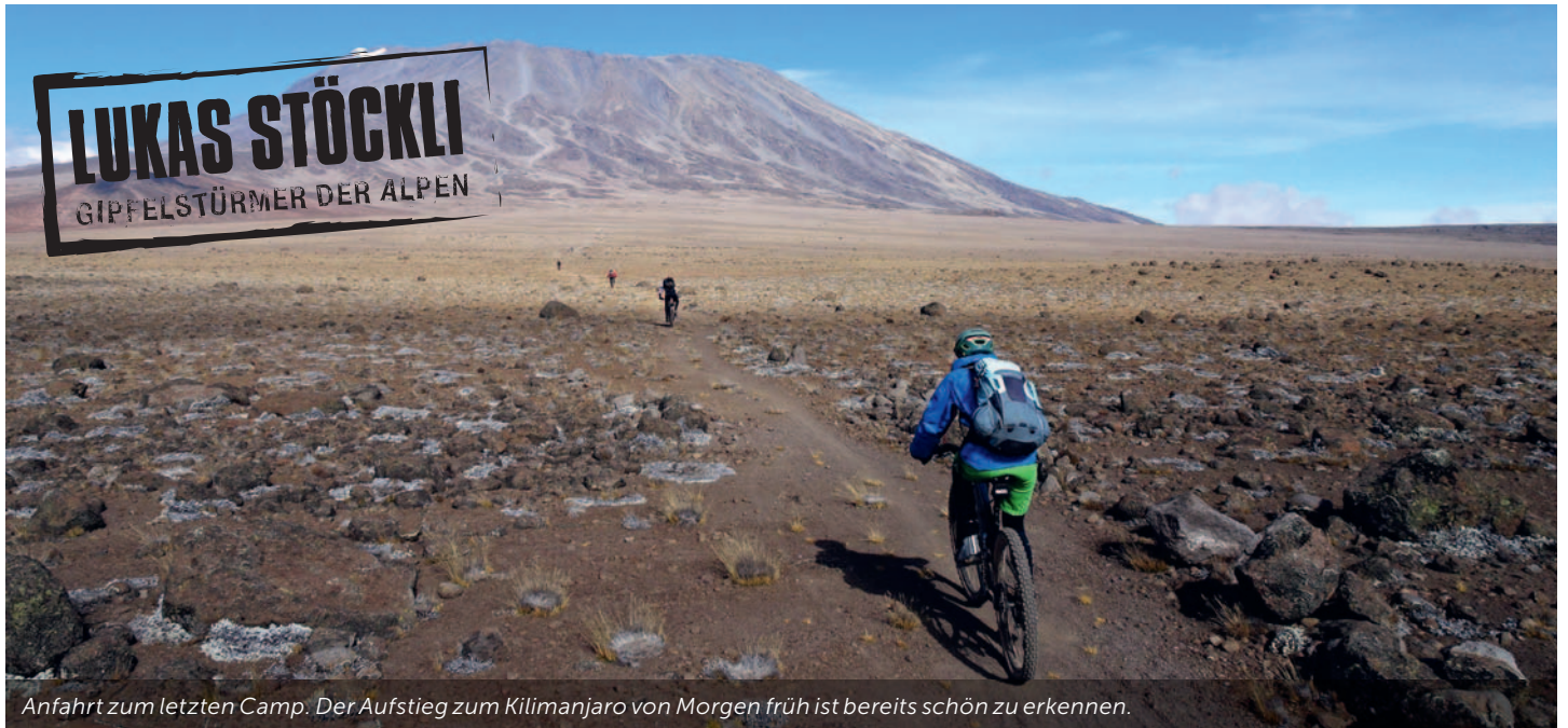
Anfahrt zum letzten Camp. Der Aufstieg zum Kilimanjaro von Morgen früh ist bereits schön zu erkennen.