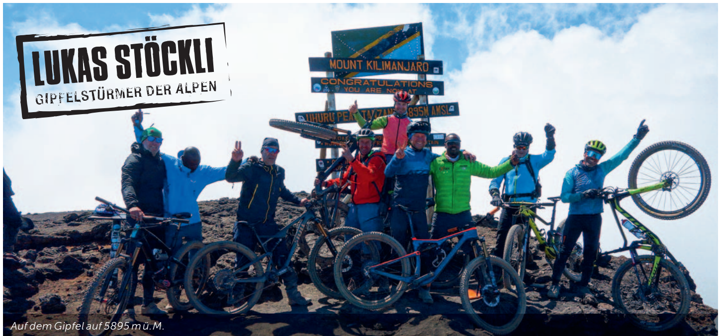
Auf dem Gipfel auf 5895 m ü. M.

stück bergab. Ca. 100 Tiefenmeter und dann ist biken durch feinen Schotter angesagt. Mit gutem Gleichgewicht kann man da ein paar Kurven «rein-wedeln». Wer will kann auf dem Trail bleiben oder in bester Direttissima senkrecht hinunterauschen. Freeride ist angesagt! Es folgen Steppenlandschaften, die in üppig spriessendes Grasland übergehen. Die ersten Sträucher folgen, die immer höher werden, bis wir auf ca. 3000 Metern vom Dschungel verschluckt werden. Bedingt durch das feucht-heisse Klima hat sich hier eine einzigartige Flora entwickelt, mit ungezählten Pflanzenarten, die in prachtvollem Wuchs gedeihen – sie werden zumeist grösser als anderswo. Schlussendlich folgen die ersten Besiedlungen in den Bananenplantagen. Hier geht es weiter bergab, bis wir nach 4500 Tiefenmetern und einer Abfahrtszeit von etwa 5–6 Stunden wieder den Talboden erreichen. Durch nahezu alle Klimazonen sind wir abgefahren und erleben dabei einen Temperaturunterschied von etwa 40–45°C. Es braucht Zeit diese Erlebnisse zu sortieren und zu verstehen, was wir da gerade erlebt haben.