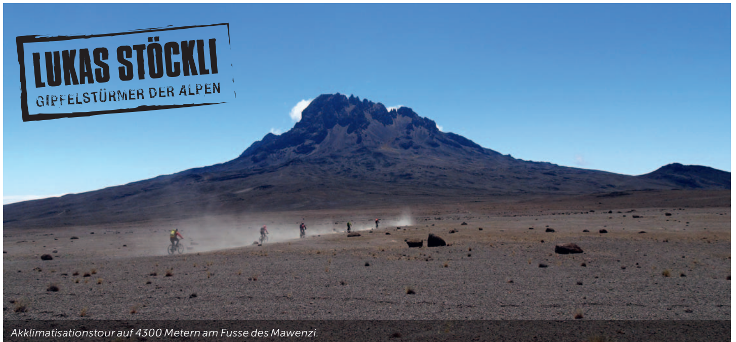
Akklimatisationstour auf 4300 Metern am Fusse des Mawenzi.

«Grenzwert» liegt. Alle anderen schieben hier, denn das Berghochfahren am Anschlag würde sich in den Folgetagen massiv rächen. Auf 3700 m ü.M. ist unser «Basislager» erreicht. Im Westen der weisse Gipfel des Kilimanjaro, der nach diesem fordernden Tag nur ein sehr kleines Stück nähergekommen ist. Unser Team kocht eine feine Mittagsverpflegung, im Anschluss geht es dann zu Fuss zum Zebrarock auf 4000 Metern Höhe. Es ist eine Akklimatisationswanderung – wenn immer möglich versuchen wir bei unseren Etappen über unsere Camps hochzukommen, um uns kurzzeitig an noch grössere Höhen zu gewöhnen.