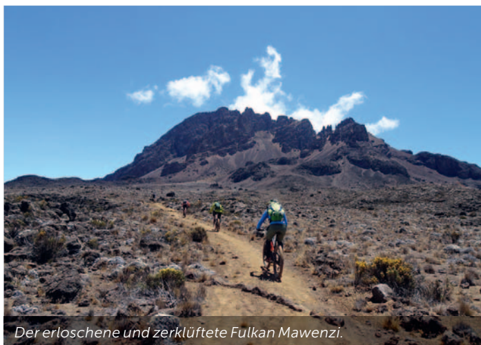
Der erloschene und zerklüftete Vulkan Mawenzi.

Tief unter uns liegt nun der Urwald, meistens ist er unter einer Wolkendecke versteckt. Abends und in der Nacht löst sich diese oftmals auf und wir erblicken die Lichter von Moshi und Arusha. Über uns der 5149 Meter hohe Mawenzi, der uns mit seiner Silhouette geradezu magisch anzieht. Der steinige Uphill ist im ersten Teil nicht fahrbar. Eine gute Möglichkeit, um das Bike-Tragesystem auszuprobieren. 300 Höhenmeter später wird die