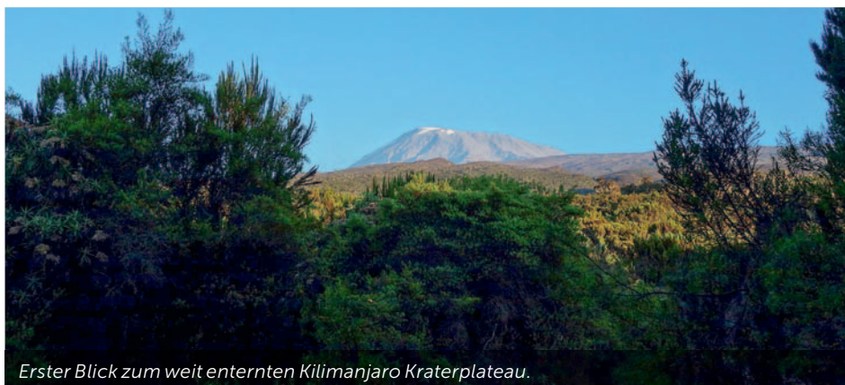
Erster Blick zum weit enternten Kilimanjaro Kraterplateau.

Ein besonderes spannendes Erlebnis ist das Wolkenpiel. Nicht selten liegt der Urwald in den Wolken und darüber erleben wir spektakuläre Fernsichten und blauen Himmel. Oft wägt man sich wie in einem Flieger, da wir uns weit über der Wolkenbasis befinden.